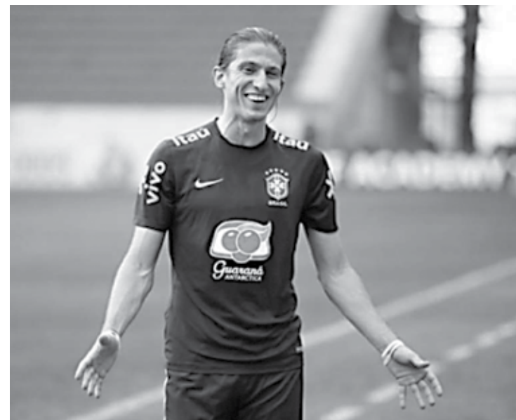
Filipe Luís segue treinando com a Seleção Brasileira nos Estados Unidos

No período em que teve o nome ligado ao clube francês, o brasileiro chegou a ser afastado por Diego Simeone, mas Filipe garantiu que nunca deixou de se esforçar e treinar no clube colchonero. Recentemente, segundo a imprensa inglesa, o Arsenal também esta-