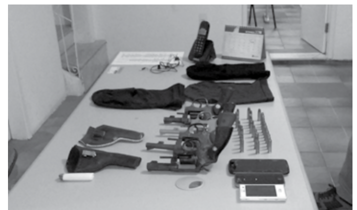
Com os homens, foram encontradas armas, munições e toucas ninjas

Os quatro foram conduzidos à delegacia, onde foram autuados pelos crimes de associação criminosa armada, posse ilegal de arma de fogo de uso permitido e posse ilegal de arma de fogo de uso restrito. Em seguida, foram encaminhados para a penitenciária lo-