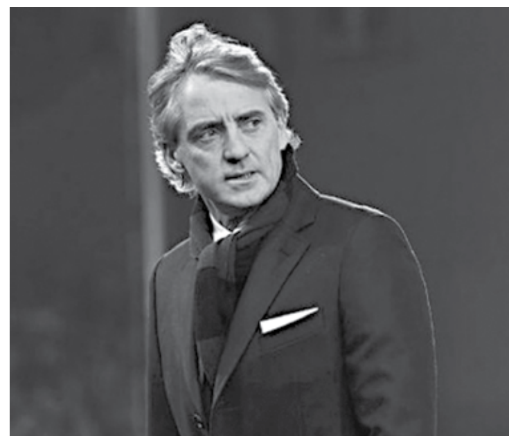
O técnico da seleção italiana, Roberto Mancini, quer apoio aos jovens do país

Na última rodada da Série A, o Frosinone foi o