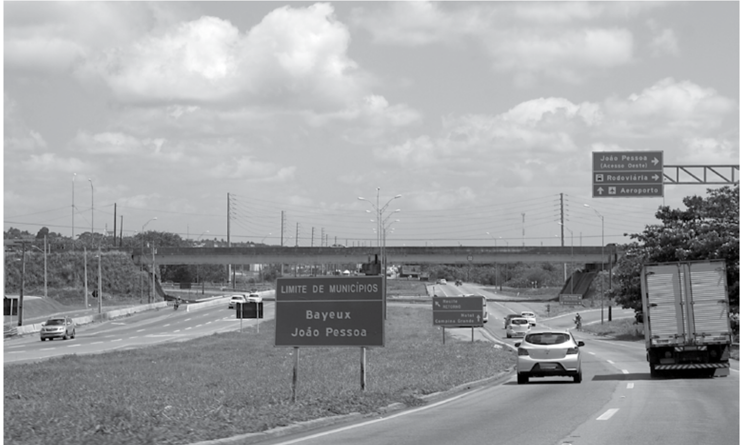
Polícia Rodoviária Federal vai priorizar a fiscalização nas BRs 230 e 101, que são as duas maiores rodovias federais de trânsito de veículos no Estado

Para comunicação de crimes e acidentes, a PRF dispõe do número de emergência 191. A ligação é gratuita e atende 24 horas em qualquer parte do país.