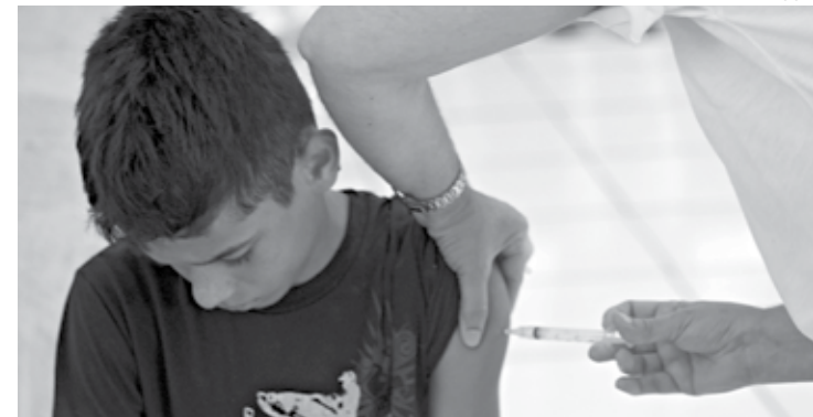
Público-alvo é de meninos de 11 a 14 anos e meninas de 9 a 14 anos de idade

ano, houve a primeira campanha de intensificação da vacina. Na ocasião, houve avaliação da situação vacinal do adolescente, referente a outras vacinas, recomendadas para esse público.