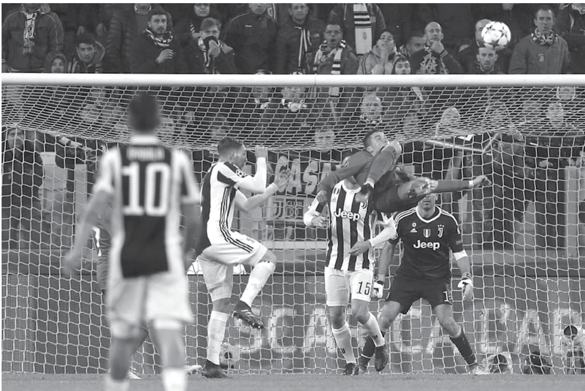
Lance da final da Liga dos Campeões desta temporada quando o Real Madrid derrotou a Juventus com um belo gol de Cristiano Ronaldo, de bicicleta, em Turim, abrindo o caminho para o título

Um dos motivos para essa possibilidade de preservação aconteceu após o jogo do último domingo, quando teve uma atuação de destaque no empate em 2 a 2 do Real Madrid Castilla contra o Atlético de Madrid B, pela Terceira Divisão Espanhola.